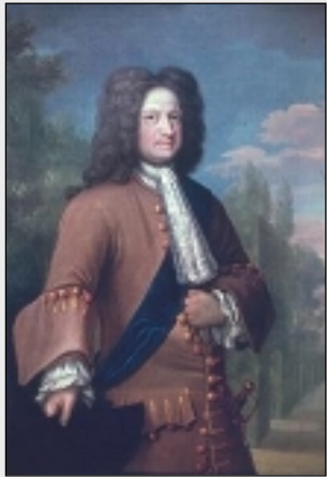
Georg Ludwig (George I) Kurfürst von Braunschweig-Lüneburg (Hanover) König von Großbritannien